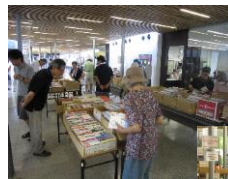
ブックリサイクル