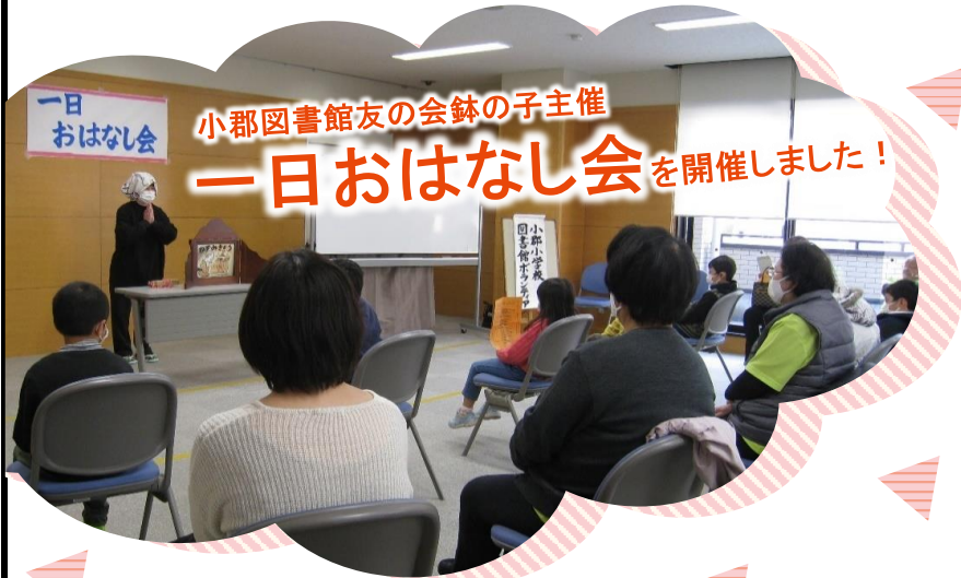
小郡図書館友の会録の子主催 一日おはなし会 を開催しました!

No. 140 発行: 山口市立小郡図書館 山口市小郡下郷609番地1 TEL083-973-0098・FAX083-973-2442 ホームページアドレス: http://www.lib-yama.jp/ メールアドレス: ogori@lib-yama.jp