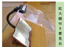
拡大鏡付き書見台

小郡図書館では本の文字を読みやすくする読書支援ツールをカウンターや大活字本コーナー付近に用意しています。ぜひ、ご活用ください。