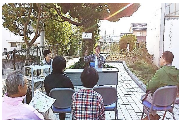
青空ビブリオバトル