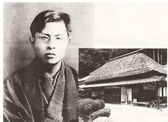
磯多忌チラシより