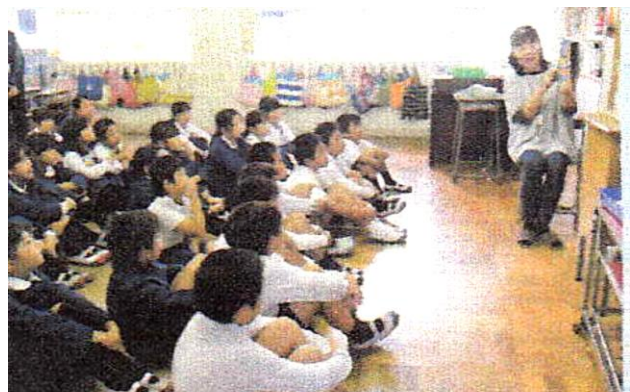
学校の広報誌「図書ボランティアの紹介」より